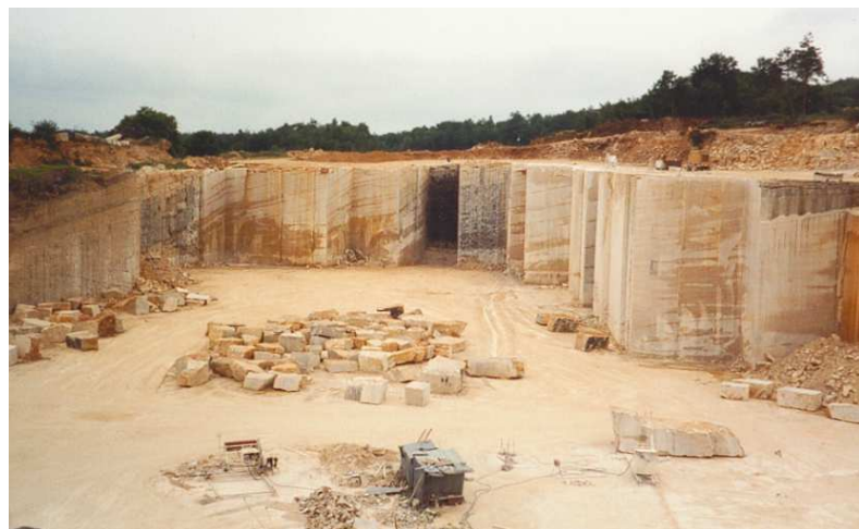
Les carrières de Massangis aujourd'hui.