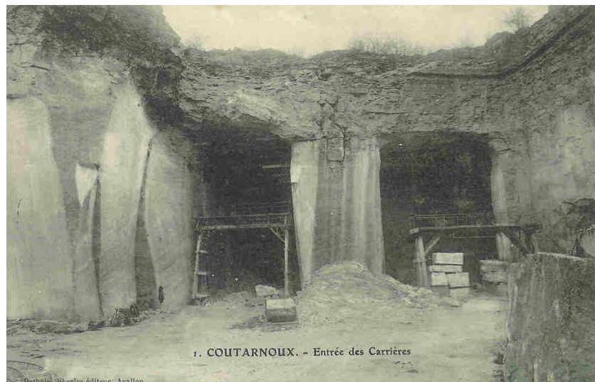
La Grotte au début du 20ème siècle.